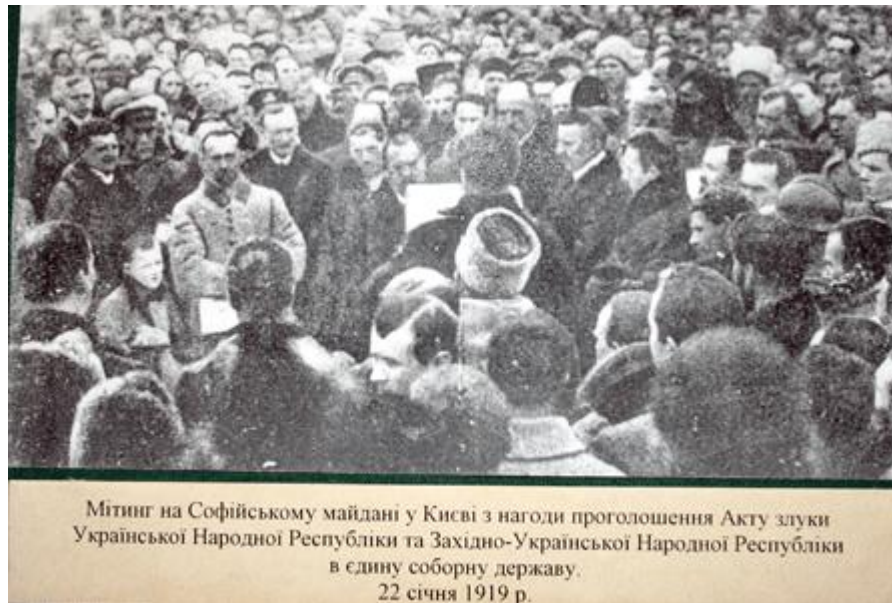
Мітинг на Софійському майдані у Києві з нагоди проголошення Акту злуки Української Народної Республіки та Західно-Української Народної Республіки в єдину соборну державу. 22 січня 1919 р.

В цьому Акті проголошувалося: “Однині воедино зливаються століттями одірвані одна від одної частини єдиної України – Західно-Українська Народна Республіка /Галичина, Буковина і Угорська Україна/ і Наддніпрянська Велика Україна.